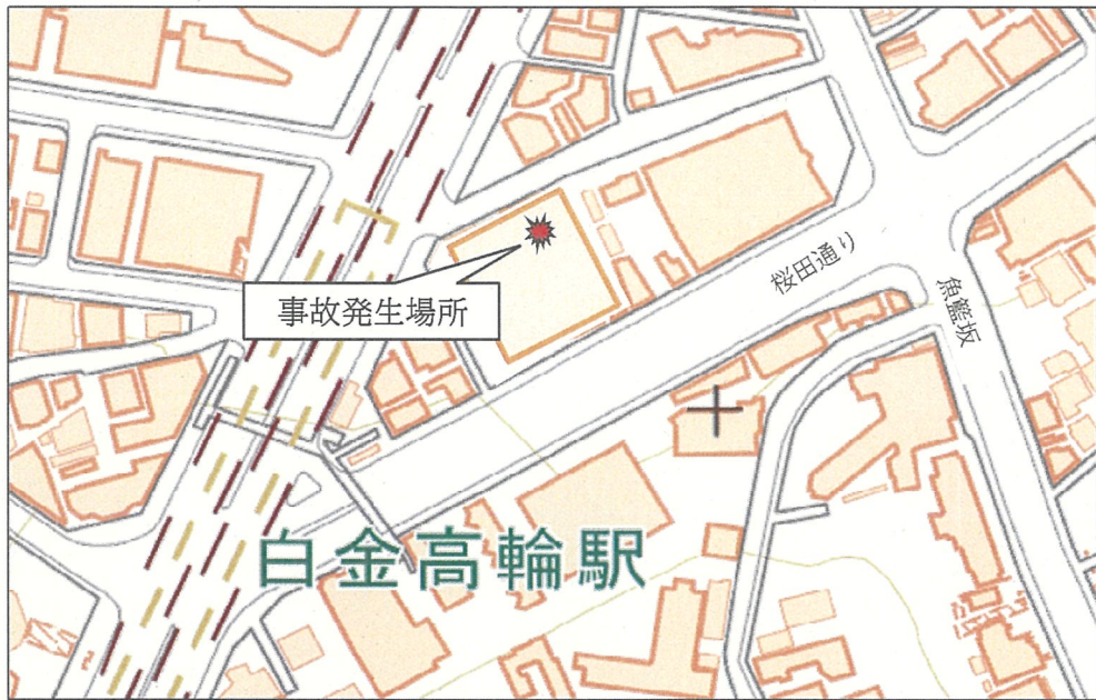
○国土地理院地図 ( http://maps.gsi.go.jp ) での事故発生場所付近イメージ