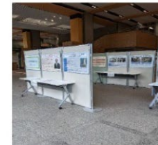
エレベーター事故風化防止等を目的としたパネル展