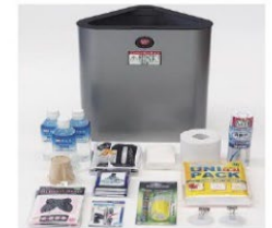
エレベーター用防災チェアと内容物の例