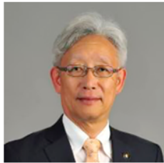
刈谷市長 稲垣 武

愛知県刈谷市長の稲垣 全国で2番目にこのプ トイレトレーラー購入 りがとうございました。 には、より多くの自治 ワークを広げていく必要 是非、プロジェクトの に参画していただきま