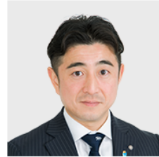
西伊豆町長 星野浄晋

災害時のトイレ問題をど トイレトレーラーに出会 「有事の際には、被災自 我が町が被災した際には 問題を解決できる。 このような取組みに賛同 という強い思いから、ト このネットワークには、 す。私たちとともに助け