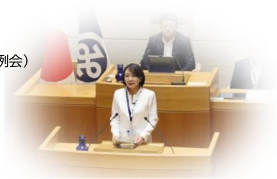
質問時使用パネル