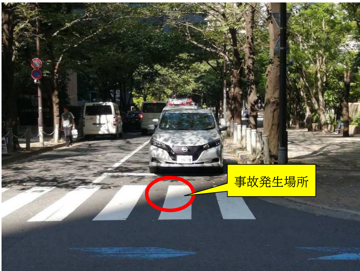
庁有車 丸枠内は接触部分（損傷なし） （前面）