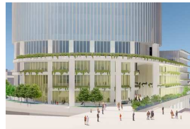
広場5号周辺のイメージ