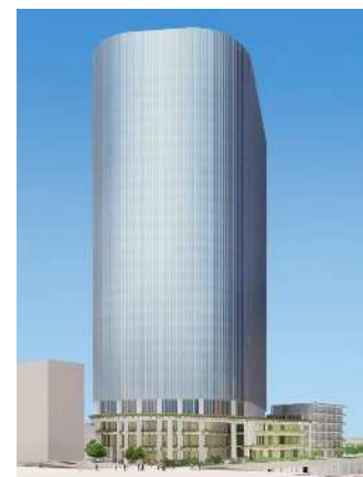
イメージパース（南東方向から）