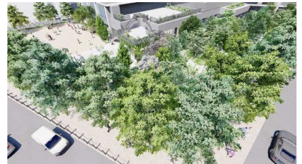
児童遊園と広場1号（北側）の整備イメージ