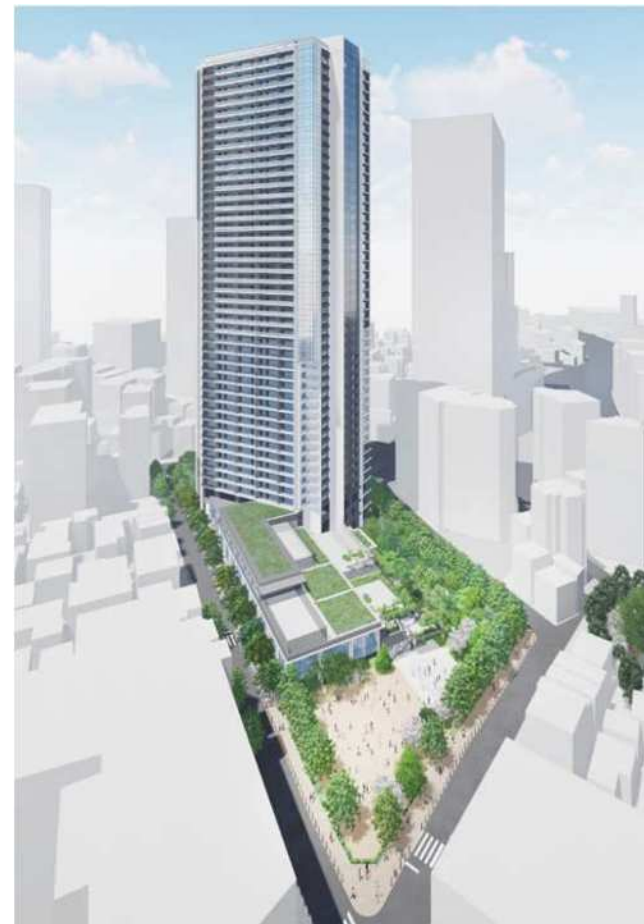
地区東からのイメージパース