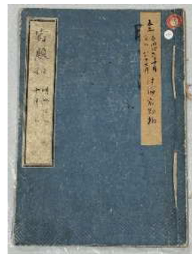
「三田演説日記 第一号」