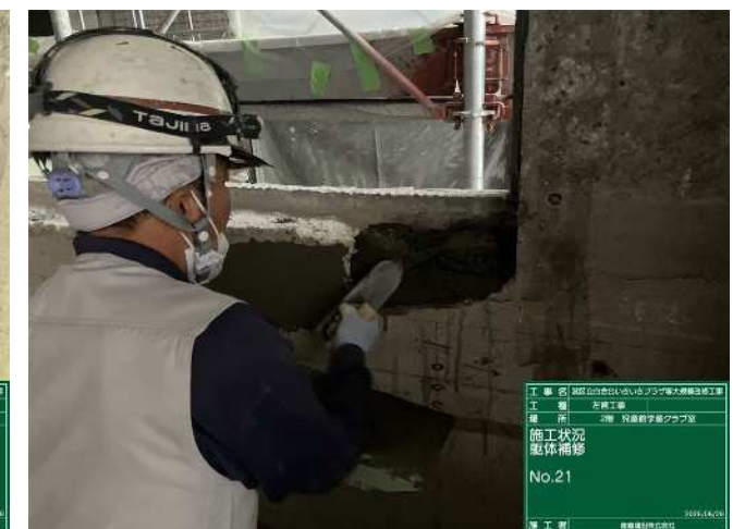
躯体欠損部のモルタル補修