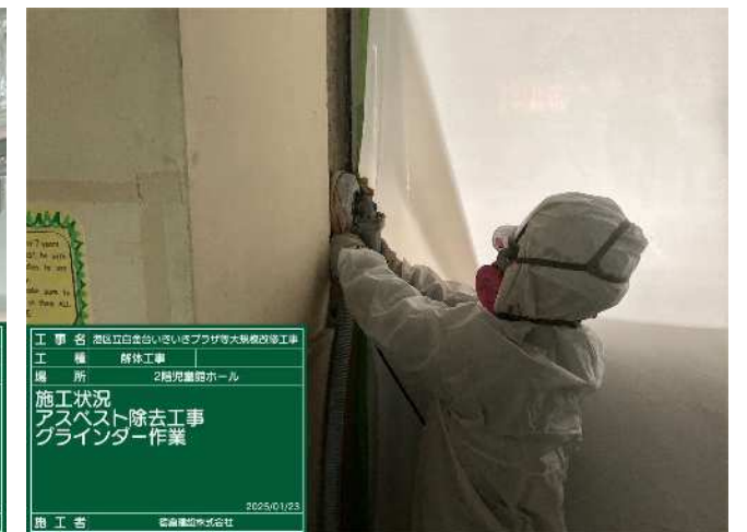
アスベスト（下地調整材）の除去