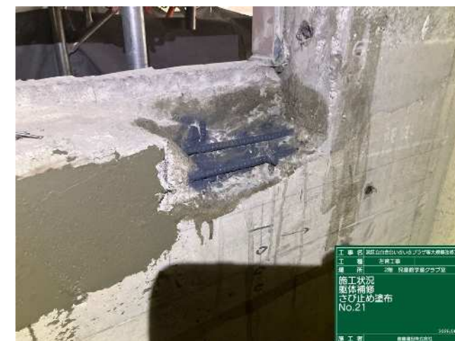
露出配筋部の錆止め塗装処理

窓枠等の仕上げ材撤去後に隠ぺい部の経年劣化による既存躯体のクラック等が見受けられ、躯体の安全性確保と劣化進行を防ぐため、これらの箇所の補修を行います。