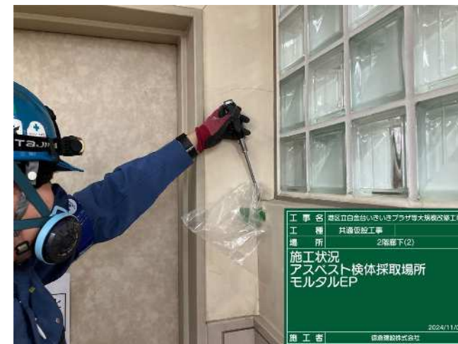
施工前調査及びアスベスト検体採取

施工者による調査で内壁や床、窓枠内等の隠ぺい部の下地調整材(モルタル)から新たにアスベストが検出されています。このため、アスベストの撤去、処分、上塗り及び囲い込み等の法定処理により、アスベストの飛散防止対策を適切に行います。