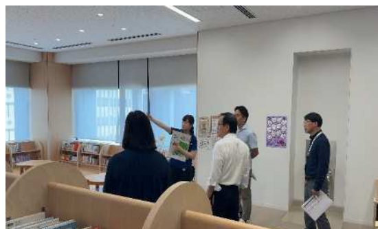
港区立三田図書館現地視察の様子