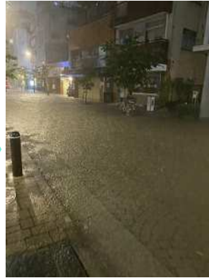
令和6年8月21日豪雨時