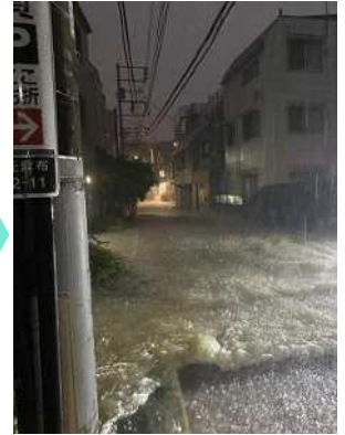
令和6年8月21日豪雨時