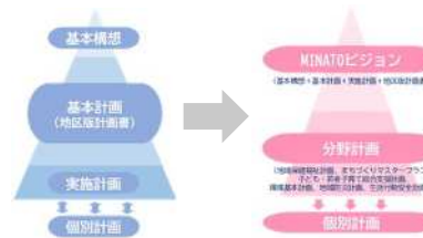
計画体系の見直しイメージ