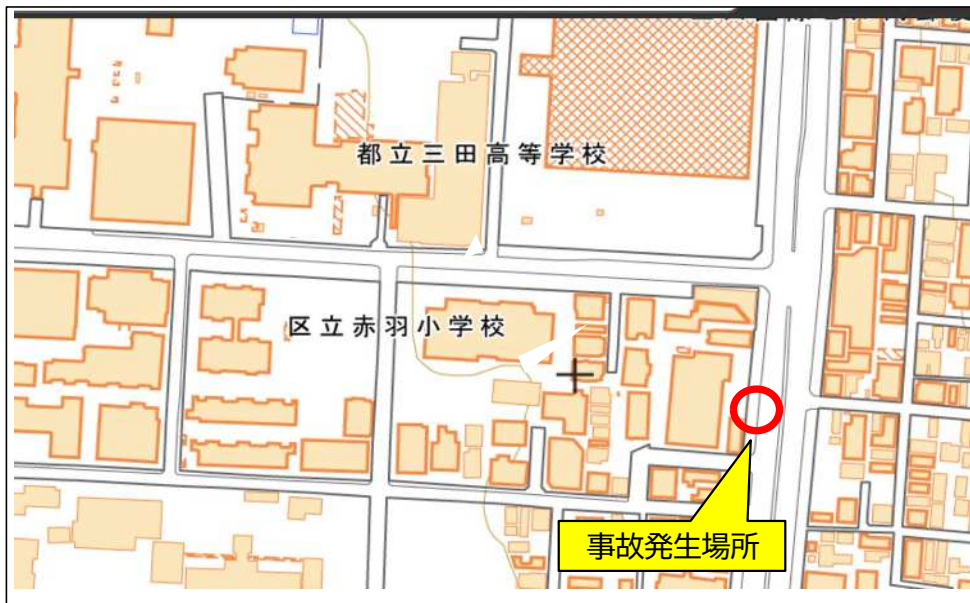
国土地理院地図（タイル）に事故発生場所等を追記して掲載