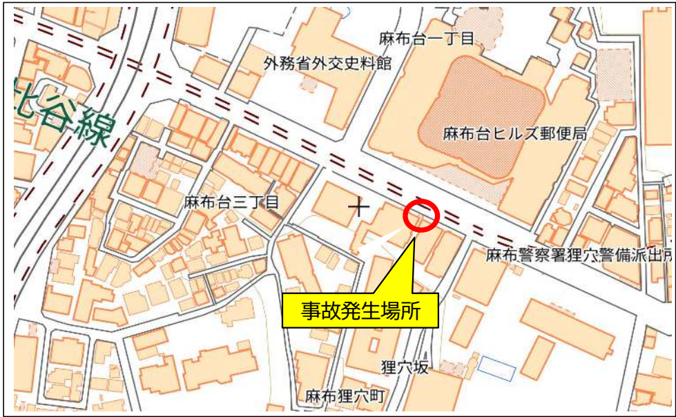
国土地理院地図（タイル）に事故発生場所等を追記して掲載