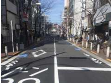
自転車ネットワーク