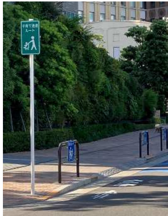
子育て送迎ルート