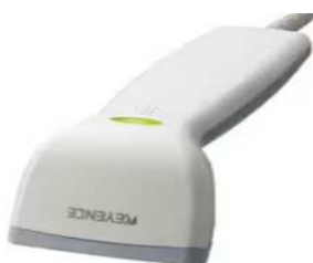
バーコードリーダー