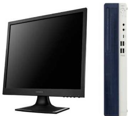
図書館システム端末機