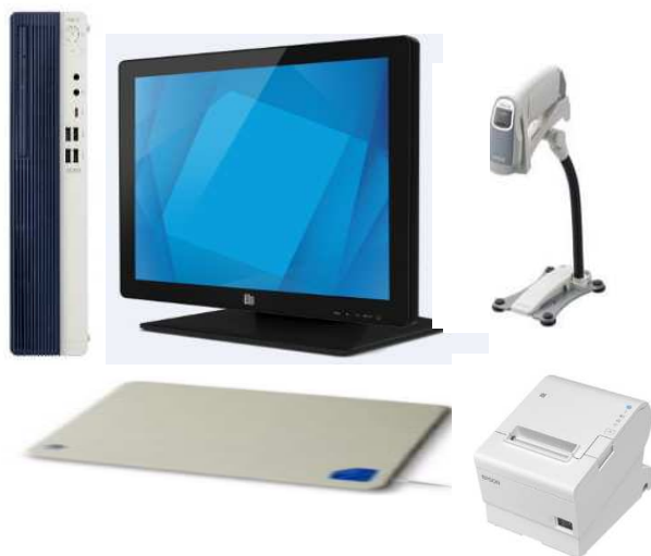
図書館資料自動貸出機