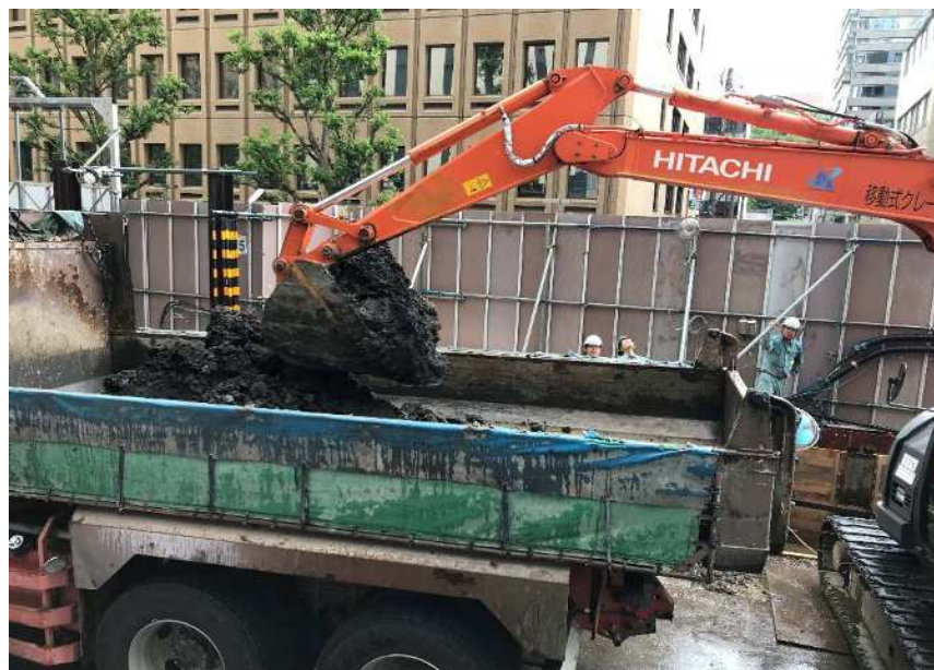
2019.6.15 Aゲート前外構 5m 3