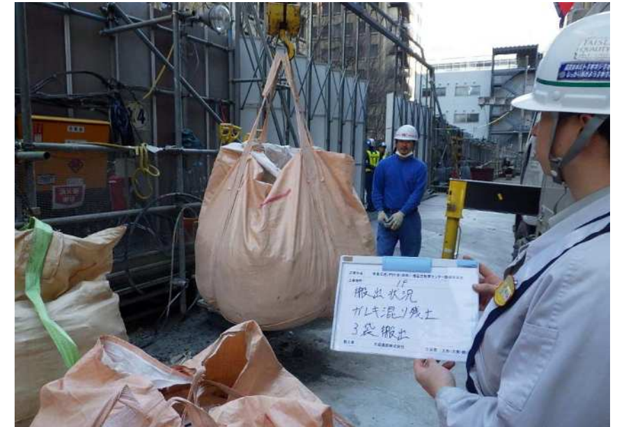
2019.3.21 Cゲート前 1.5m 3