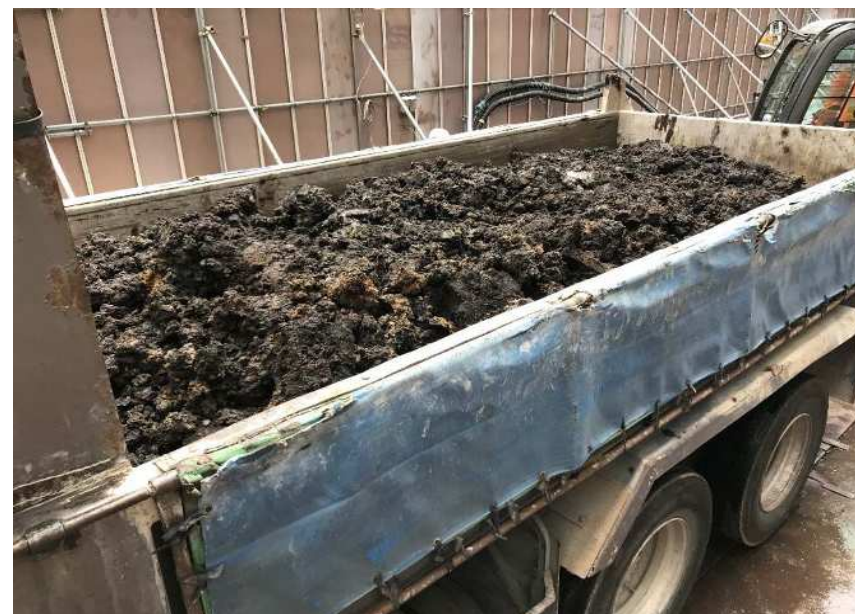
2019.6.22 Aゲート前外構 5m 3