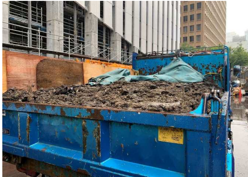
2018.9.27 Aゲート前外構 5m 3