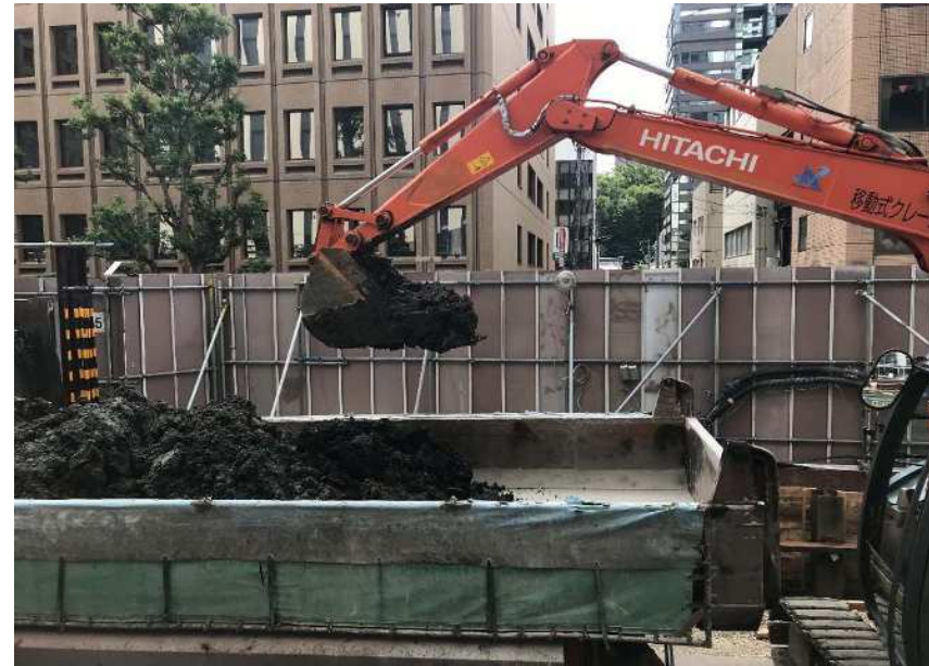
2018.11.10 Aゲート前外構 5m 3