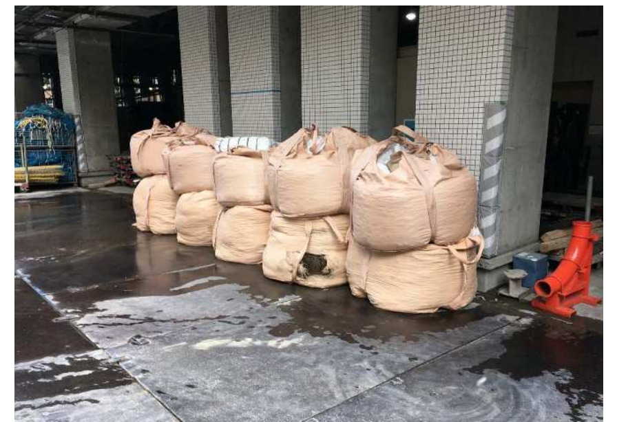
2019.9.4 Cゲート前外構 6.5m 3