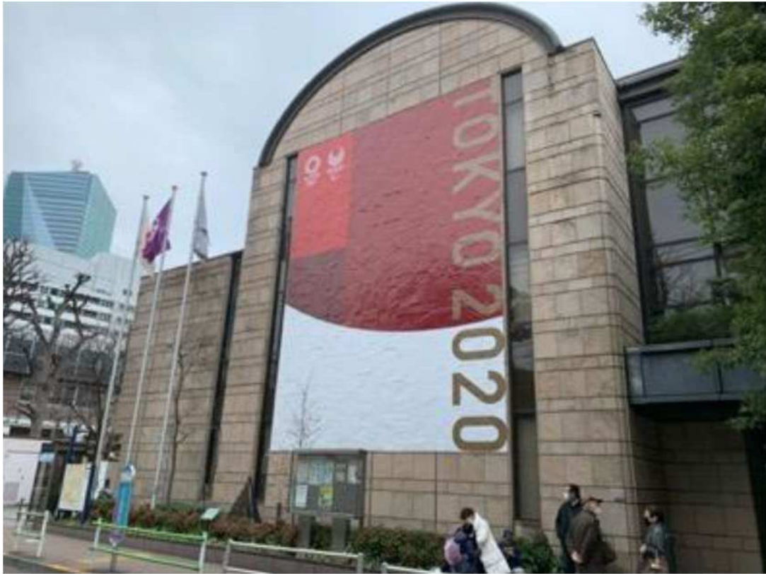
赤坂地区総合支所【施工後】