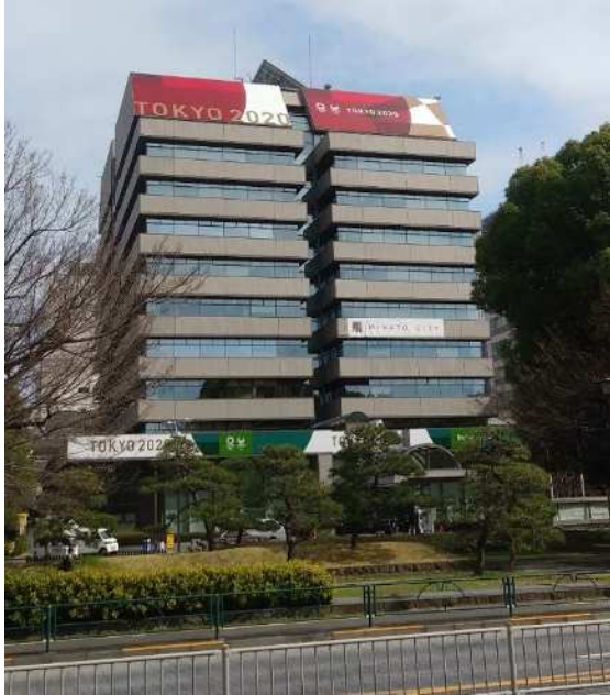
日比谷通りから撮影